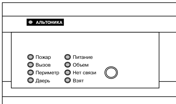
Рисунок 1 – Внешний вид приемника

Приемник имеет 9 индикаторных светодиодов (см. рисунок 1), разделенных по назначению на несколько групп.